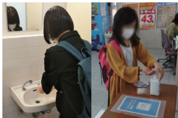
登校時の手洗い・消毒