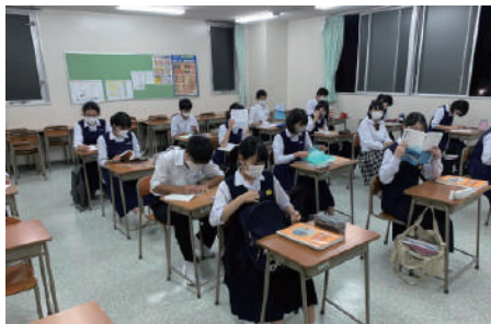
休憩時間の換気を徹底