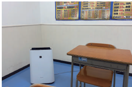
空気清浄機の設置