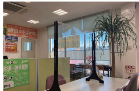
アクリル板の設置